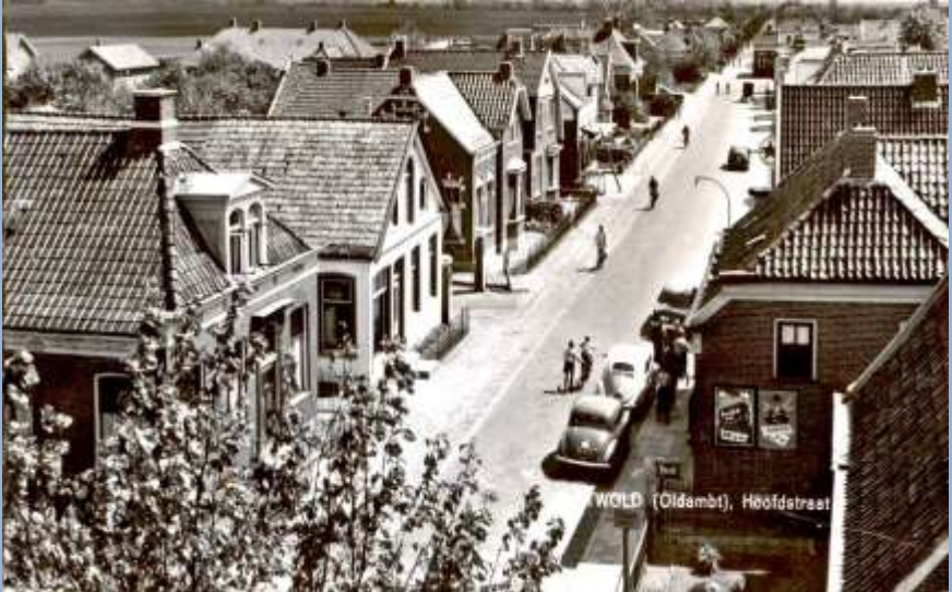
Hoofdstraat, Oostwold, vanaf het dak van Hotel de Witte Zwaan.