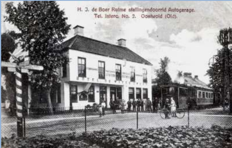
Hotel de Witte Zwaan, met de tram Ol Grait. Op de gevel staat geschilderd Stoomtramwegmaatschappij Oostelijk Groningen, Station Oostwold, Hotel de Witte Zwaan.

Onze naburige dorpen hadden ook wel een hotel, maar dat waren van die "eenvoudige optrekjes", dat mocht geen naam hebben die konden niet in de schaduw staan bij dat wat in het centrum van ons dorp stond.