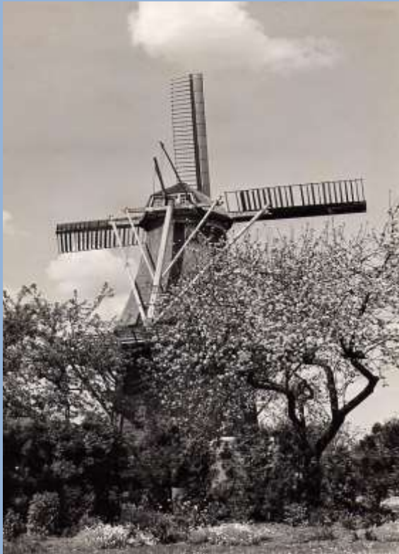
Molen aan de Goldhoorn 1950

Het normale gebruik van overgordijnen was vaak onvoldoende om het licht te weren. Mijn moeke en vele andere mensen, hadden daarom zwarte papieren rolgordijnen gekocht, die je vlak tegen het venster kon ophangen en die - in combinatie met de overgordijnen - geen glimpje licht meer doorlieten. Het vaak uitvallen van de elektriciteit was een probleem. De kaarsen die we hadden waren al lang op en niet meer te koop. Wat nu? Goede raad was duur. Er waren mensen, die.