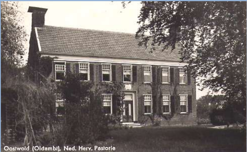
Oostwold (Oldambt), Ned. Herv. Pastorie

Maar wij kwamen voor het ijs van Domie's gracht. Kijken of het wilde houden en zo ja of wij dat ijs tot behoorlijke ijsschotsen zouden kunnen verwerken, want dat was onze sport: scholletje lopen. Dank zij onze enthousiaste inzet lukte dat snel en goed, in een mum van tijd hadden wij de mooie ijsvloer tot grote en kleine schollen verwerkt. De