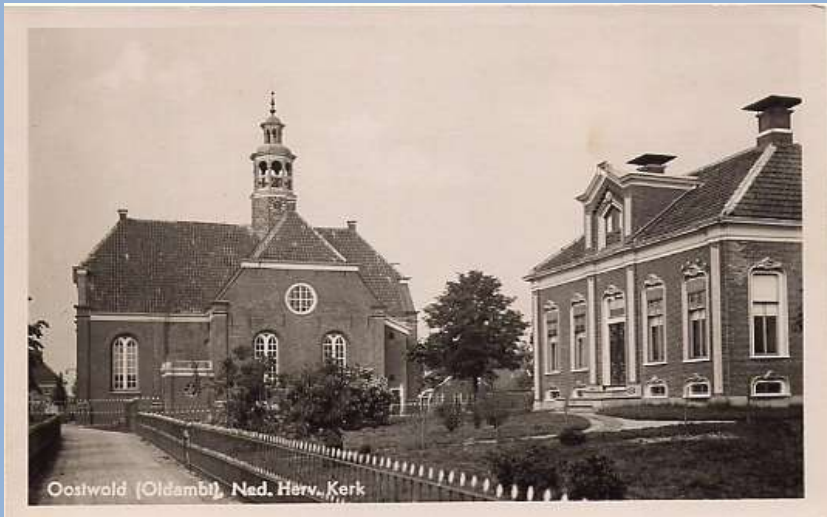
Woning, hoofdmeester Openbare School

van die mooie krijtjes in mijn broekzak. Natuurlijk had ik er niet over nagedacht wat ik er mee moest, want een schoolbord of zo had ik niet. Maar ik vond de kleuren zo mooi. 's Avonds in bed werd ik erg onrustig. Wat had ik toch gedaan? Mijn geweten begon te knagen. Maar ik durfde het niet aan mijn ouders te vertellen; ik durfde het niet te bekennen aan het hoofd van de lagere school en ik durfde ze ook niet terug te brengen. Goede raad was duur. Ik heb ze ongeveer vierentwintig uur in mijn bezit gehad. De volgende dag toen het begon te schemeren, heb ik met mijn handen een gat gemaakt onder het hek, dat rond de kerk staat. Daarna heb ik het gat dichtgemaakt met aarde. Weg is weg! Ik weet niet of krijt goed bestand is tegen langdurig verblijf in aarde. Als dat wel zo is, dan moeten ze daar nu nog liggen. Ik geef toe, het was niet zo'n elegante oplossing van mijn probleem.