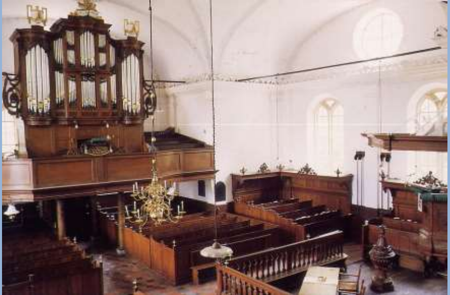
Nederlands Hervormde kerk

In het vorige hoofdstuk heb ik gesteld, dat de Nederlands Hervormde Kerk en de daarbij behorende pastorie zeer dominant in ons dorp aanwezig waren en zijn. Dat is ook zo. We zouden deze kloeke kerk tekort doen als we aan haar geschiedenis verder geen aandacht zouden besteden. Ik wil dat nu graag doen. Op 1 april 1972 vierde de Christelijke Jongelingsvereniging "Eben Haëzer" haar honderd jarig bestaan. Ter gelegenheid van deze viering heeft de toenmalige voorzitter een herdenkingswoord uitgesproken onder de titel: "k Zal gedenken.....". In het begin van dat herdenkingswoord staat hij ook stil bij de geschiedenis van zowel de kerk (het gebouw) als bij de soms turbulente ontwikkelingen in de Hervormde gemeente zelf.