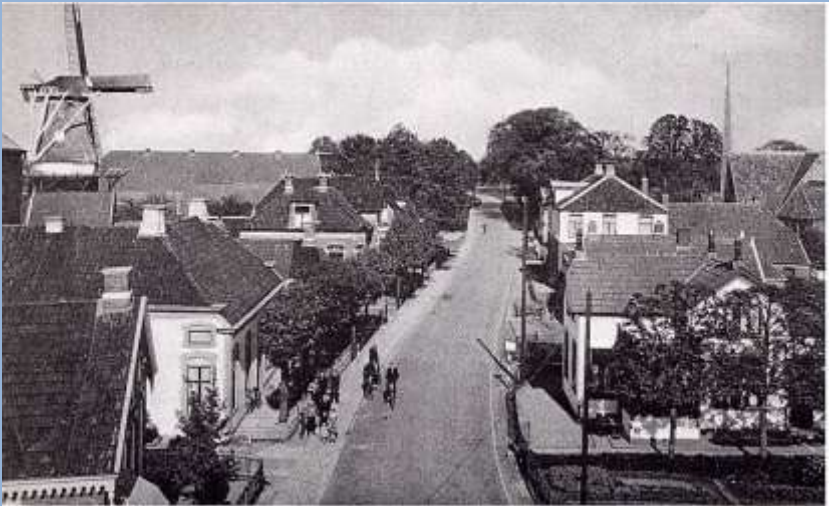
Goldhoorn 1936, links is het pakhuis nog net te zien.