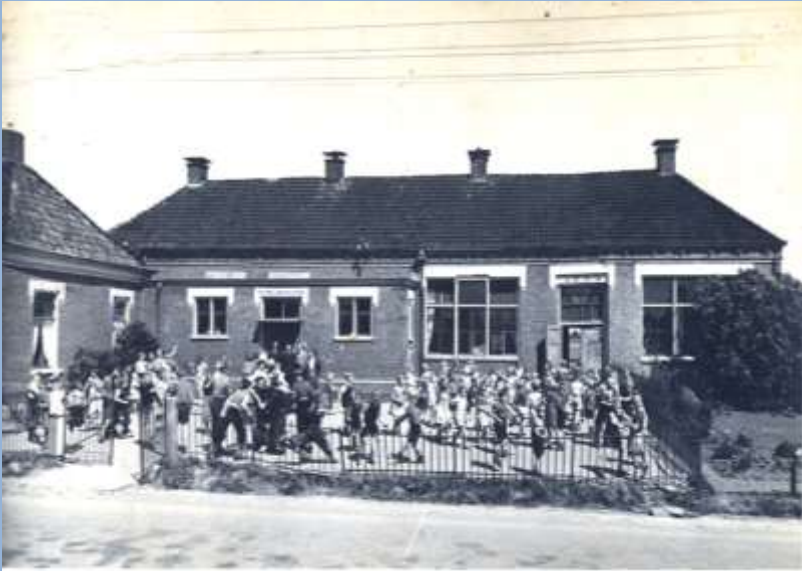
Hervormde school, 1950

De aanwezigheid van de man in ons dorp intrigeerde ons. Want ook als hij niet in de buurt was dan was hij er toch. Er was van onze kant vaak de uitdaging en het spel, dat tussen hem en ons werd gespeeld. Wij moesten hem in de uitvoering van ons kattekwaad te slim afzijn. Dat was niet zo'n grote kunst. Ons dorp telde drie scholen: de Hervormde School met de Bijbel, de Christelijk Nationale School en de Openbare School. De leerlingen van deze scholen leefden in een voortdurende staat van oorlog. Er was steeds wapengekletter. We spraken lelijke woorden tegen elkaar,