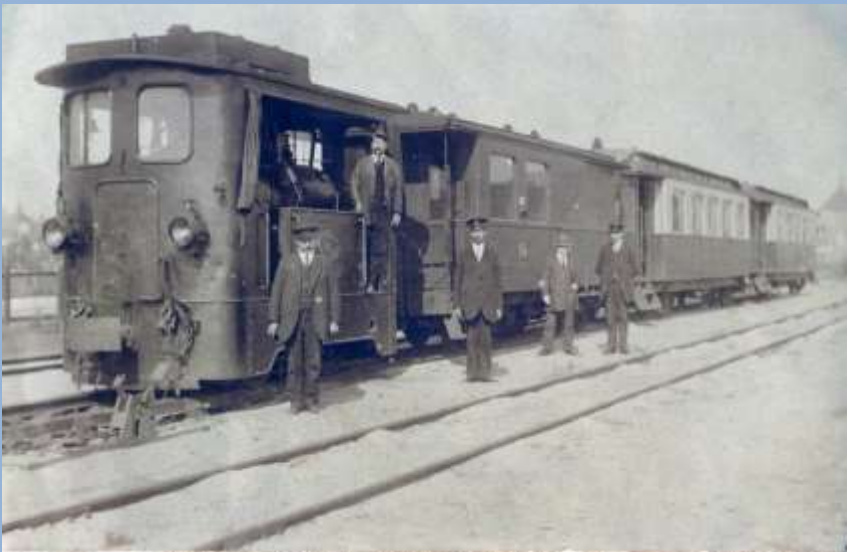
Tram van de Stoomtramwegmaatschappij Oostelijk Groningen, genaamd Ol Grait.

Dat waren prachtige dagen. Maar nu onze tocht. De eerste halte na ons dorp was de halte Oostwolderpolder, een kilometer vier of vijf bij ons vandaan. Dat was het doel. We hadden ons opgesteld, bij het Station "Hotel de Witte Zwaan". De tram naderde langzaam door het dorp. De machinist hing – zoals gebruikelijk - met zijn linkerarm door het open raam en de stoker gooide nieuwe kolen op het vuur, terwijl de conducteur - keurig in uniform - zwierig uit de tram stapte en luidkeels verkondigde: " Station Oostwold, Hotel de Witte Zwaan, Station Oostwold, Hotel de Witte Zwaan ". Iedereen wist dat natuurlijk wel, maar