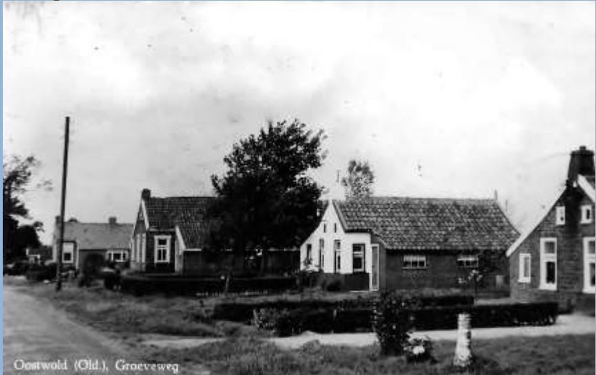
De Groeveweg, Meerland

verscheidene jaren ligt er echter een nieuw gedurfd en groots plan voor het Meerland op tafel. "De Blauwe Stad". Het Meerland gaat weer onder water. Nee toch zeker? Ja toch zeker. Schrijver, de heer J.P. Koers uit Midwolda schreef in het jaar 2000 een artikelenreeks in het 7 blad: "De grote veranderingen, die voor het gebied tussen Winschoten en Oostwold staan te gebeuren zijn niet meer tegen te houden, daarvan zijn vriend en vijand inmiddels wel overtuigd. Op de tekenafels is het prestigieuze waterwoongebied al lang een realiteit en ook het moment, dat het gestalte krijgt in het landschap, komt snel naderbij. Had bovenaangehaalde schrijver D.S. Hovinga in 1968 een vooruitziende blik of lagen er toen al vage plannen op tafel. Want hij schreef toen in hetzelfde artikel: "Zal het Meerland ook in de toekomst blijven bestaan? Wie weet of het nog geen grote recreatiemogelijkheden in zijn schoot verbergt".