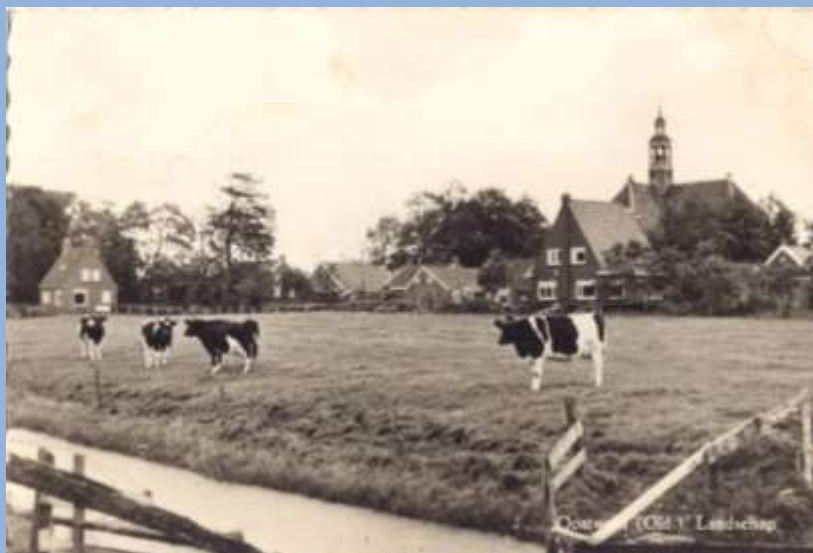
Oostwold, op de achtergrond Wilhelminalaan, 1950