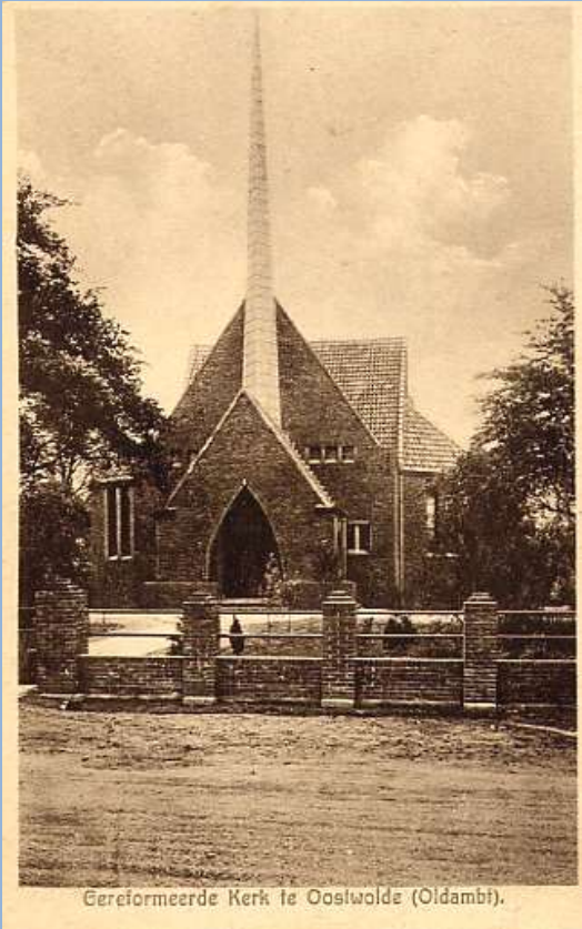
Eerste ansichtkaart van de Gereformeerde kerk 1930

feestzaal. Het was oorspronkelijk gebouwd als Gereformeerde Kerk. Maar in 1930 werd dit gebouw te klein en werd op de Goldhoorn een nieuwe Gereformeerde Kerk gebouwd. Daarna heeft een tijdlang de heer P.K. Koning het gebouw in gebruik gehad als schuur om varkens te mesten en daarna werd het als feest- en vergaderzaal gebruikt. In de volksmond werd daarom het gebouw getypeerd met: geestelijk, beestelijk en feestelijk.