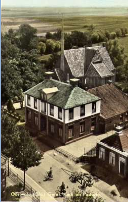
Gereformeerde kerk en pastorie, op de voorgrond smederij Lesterhuis