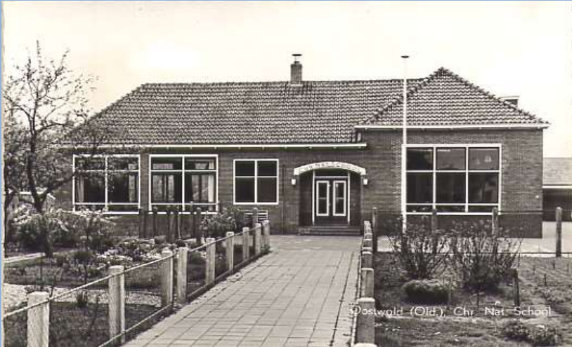
Christelijk Nationale school

Het was in de oorlogsjaren. Ik denk in 1943 of 1944. Voedsel werd steeds schaarser. Fruit ook. Koningin Wilhelmina en de Nederlandse Regering waren in Londen. Op zeker moment had het Hare Majesteit Koningin Wilhelmina behaagd om, uit eigen zak, alle schoolkinderen in Nederland te voorzien van extra fruit in de vorm van sinaasappelen. De bezetter had er in toegestemd, dat het Rode Kruis de distributie op zich nam. En zo was ineens heel Nederland, oranje gekleurd, althans op de scholen. En dat was een mooie bijkomstigheid. Want onze driekleur met oranjewimpel was in de oorlog natuurlijk verboden. En zo kwam het oranje langs een achterdeur naar binnen. Het ging dus niet alleen om de vitaminen, het ging ook om het oranjegevoel. Ook bij ons op school werden ze bezorgd. Kisten vol grote navelsinaasappels werden opgestapeld in het broodeterslokaaltje. Het broodeterslokaaltje, was een klein lokaal waar de overblijvende kinderen, die van ver kwamen, hun brood in de middagpauze aten. Daar lagen ze dus! De school waarover