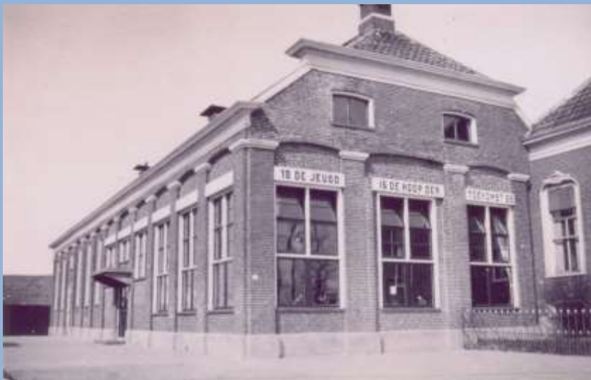
Openbare School, omstreeks 1938.

Maar dat was nu juist spannend en dat gaf een kick. We zagen nu de materialen dichtbij. En wat ik zopas door het raam nog niet had gezien, zag ik nu wel. Een houten bakje met prachtige kleurkrijtjes. Krijtjes in prachtige kleuren: wit, roze, zacht blauw, zacht geel en zacht rood. Pasteltinten waren het. Ik wist toen nog niet dat dat zo heette. Als ik dat wel had geweten, had ik ze denk ik nog mooier gevonden. Ik vond ze mooi en was er helemaal door gefascineerd. Ze waren schitterend en zo dichtbij en ik had ze zo voor het grijpen. En dat deed ik dan ook. Ondoordacht. De begeerte had toegeslagen. En zo gleden een vijftal