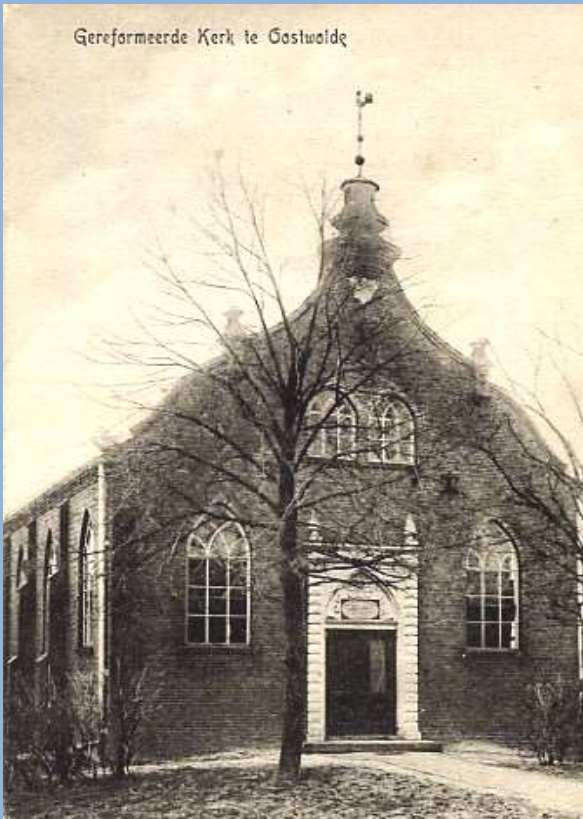
Gereformeerde kerk Pro Rege, aan de Noorderstraat

Ik vind het opvallend en merkwaardig, dat ik na zoveel jaar nog zoveel in mijn geheugen vind opgeslagen. En het maakt niets uit of het nu psalmversjes zijn, de bijbelboeken, de plagen van Egypte. De koningen van Israël, de Richteren of de Duitse woordjes. In eerste instantie begrijp je niet altijd de diepere betekenis van het geleerde, maar later als je het wel kunt en wilt begrijpen, kan het opgeslagene in je geheugen dienen als een aardige kapstok. Ik zou willen zeggen, alsnog veel dank aan de Christelijk Nationale School te Oostwold.