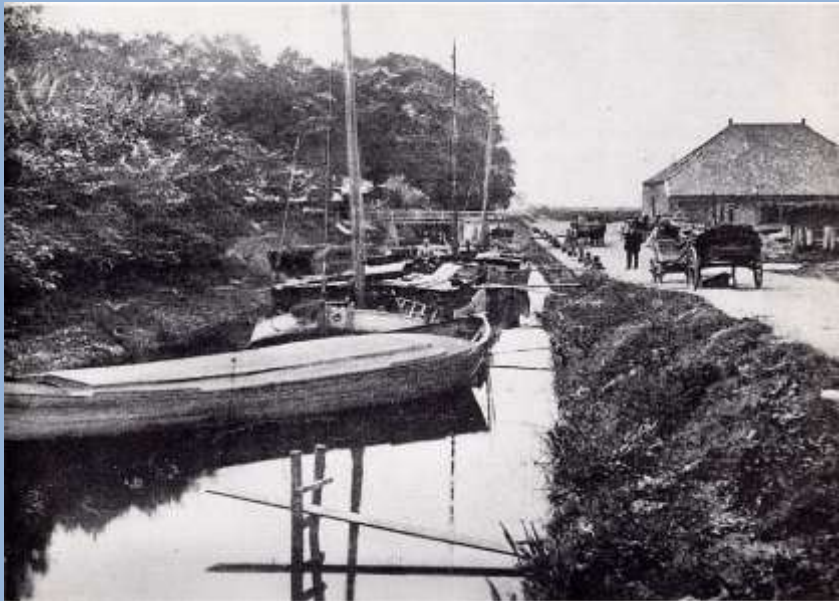
Haven van Oostwold rond 1900