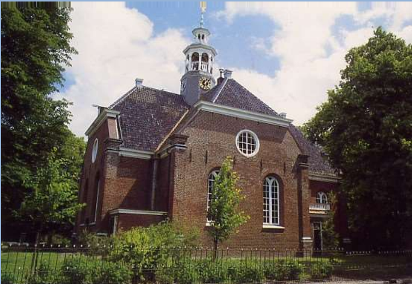
Nederlands Hervormde kerk, westzijde.

's Avonds maakten pa en moeke een wandeling door het dorp en gingen naar hun groentetuin op inspectie. Wij - de jongens - trokken nog wat met vrienden op en tegen half negen verdwenen we in de bedstee. pa en moeke volgden ons dan meestal een uur later al. Na een week van hard werken hadden ze dat ook best verdiend. De strijd om het bestaan was weer geleverd!